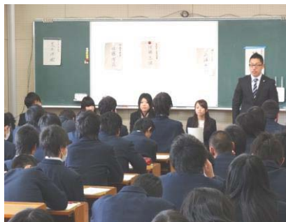
在校生全員対象の卒業生懇談会