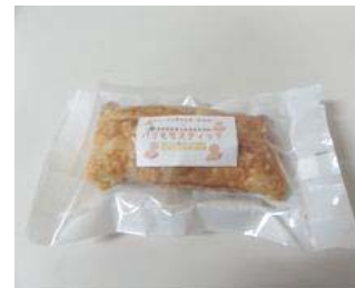
プロデュース商品「ハリもちスイーツ」