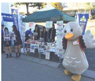
大崎市鹿島台互市での販売

商業高校として人材育成のために特色ある専門教育を行っております。地域と連携した自らがプロデュースして商品開発の実践や、高校生が開発した商品を販売する活動もしております。