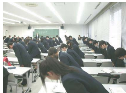
3学年：ビジネスマナー講習