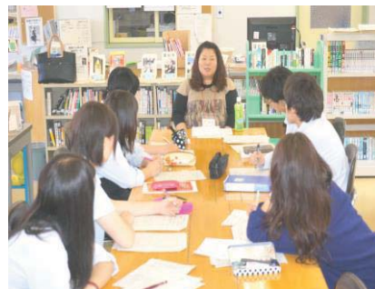
全学年：キャリアセミナー