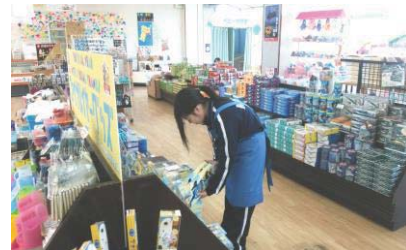
インターンシップ（就業体験）