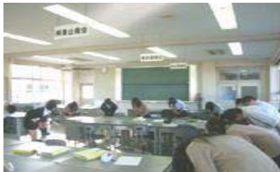
ビジネスマナー講習会（実技）