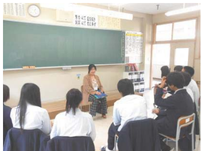
全学年：キャリアセミナー

全国的に質・量とも様々な外部講師にお越し頂いている高校はなかなかありません。質の高い学校独自教材を使用して学ぶことで、立派な社会人になることができます。