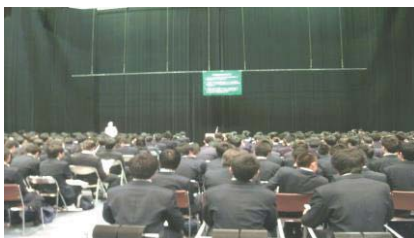
就職ガイダンス参加