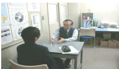
キャリアカウンセリング

卒業後、社会人で生きていくためのコミュニケーション力を高め、働く力を身につけていきます。