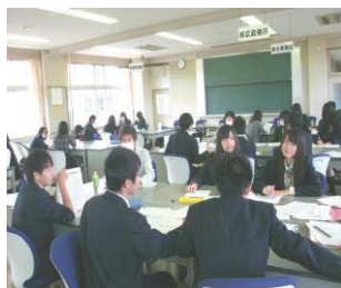
大学生からの指導・支援