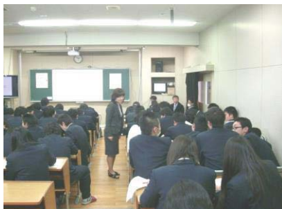
3学年：社会人準備セミナー