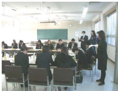
卒業生を多数招いての懇談会

過去7年間（平成22～28年度まで）の卒業生全員（421名）の本人及び職場に卒業後も継続的にフォローすることによって、全国の高卒者の離職率と比べ、早期離職は少なくなってきております。 若い人材の早期離職問題・長い人生を見通したキャリア教育に最も力を入れております。