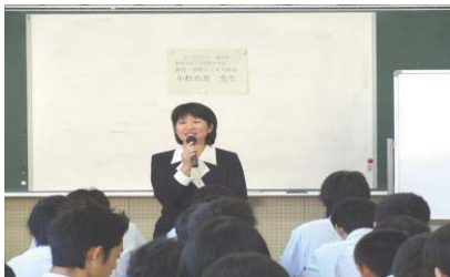
ビジネスマナー講習会（理論）

2学年では全員が3日間のインターンシップを行っております。事前学習では、かなり専門的にビジネスマナーを学ぶことができます。