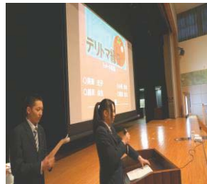
学習成果発表会で成果発表