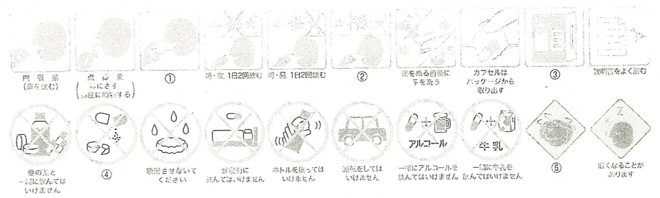
図 薬の絵文字「ピクトグラム」について

1粒飲むだけで、運動したときと同じ効果が得られるという「魔法のクスリ」は昔はSFの世界の専売特許でしたが、今や真剣に実現可能性が議論される状況になっています。運動の効果として、まずあげられるのは筋力の増強やエネルギー利用効率の向上であり、それを目的にしたいわゆる「運動薬」の動物実験がすでに報告されています。とはいえ、その実現は、それほど簡単なことでもなさそうです。なぜなら、運動の結果として、高い運動能力を得ることができなければ意味がないからです。そのためには骨の強化や心肺機能の改善などが必要であって、それは筋肉にだけ作用する運動薬では実現不可能です。結局、実際に運動するのがもっとも効果的という結論になるというわけです。