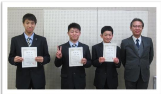
【新会長&新副会長 校長先生と共に】

11月末に行われた生徒会役員選挙により生徒会メンバーが決定し、1月7日の放送による全校集会後、生徒会役員認証式が行われました。いよいよ生徒会始動です!!後輩に引き継いでくれた3年役員のみなさん、今年度はコロナ禍で思うような活動ができず苦労も多かったと思います。大変お疲れさまでした!