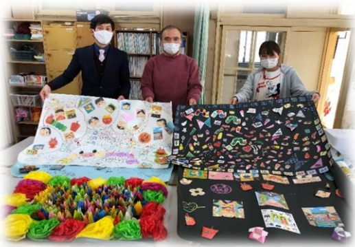
【鹿島台中央児童館の皆様と】

各クラス、鹿商祭で制作した折り紙等の作品を鹿島台中央児童館へプレゼントしました。例年行っていた児童館での「読み聞かせ」が今年度は実施できなかったこともあり、企画しました。来館するみなさんに喜んでいただけたら嬉しいです!