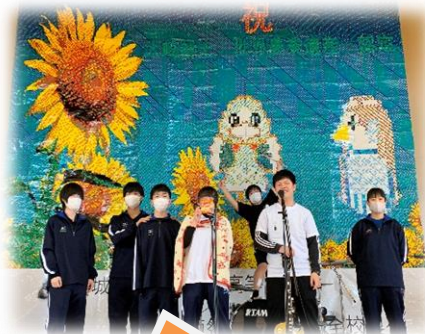
11月に演奏した 鹿商祭の1コマ

私たちは音楽室で毎日練習に励んでいます。活動している部員は少ないですが、バンドや音楽、楽器演奏が好きな人が練習を続け、やっと1つバンドができました。普段は鹿島台町内のイベントに参加するのが恒例となっていました。今年度はそのイベントも中止となり、文化祭で初めて演奏をしました。来たる次のライブに向けて練習を続けていこうと思います。