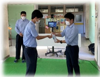
【昇降口でのあいさつ運動と手指消毒声かけの様子】

生徒会役員の“あいさつ運動”と“昇降口での手指消毒&検温の声かけ活動”は4月からの継続した取組ですが、鹿商の朝の風景となっています。 7月には保護者のみなさんにも加わっていただき、一緒に校門でのあいさつ運動を行うことができました!!ご協力いただきありがとうございました。