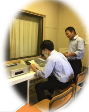
“生徒会役員”による放送室での司会進行の様子

今年度の生徒総会は、放送での実施となったため、例年とは異なる点も多くあり苦労しましたが、生徒の皆さんにも協力していただき無事に終わることができ良かったです。