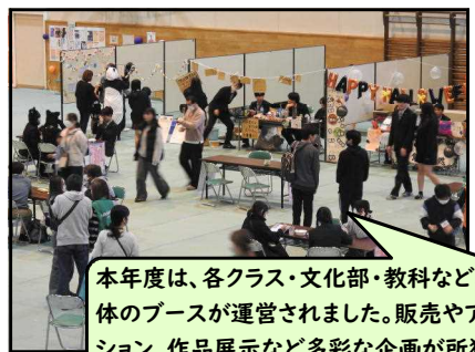
本年度は、各クラス・文化部・教科など、15団体のブースが運営されました。販売やアトラクション、作品展示など多彩な企画が所狭しと行われ、会場は賑わいをみせました。