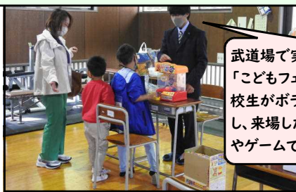
武道場で実施したケアブレンド「こどもフェスティバル」では、本校生がボランティアとして活動し、来場した子ども達とおもちゃやゲームで遊びました。